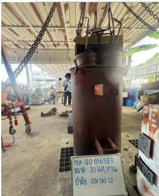
รูปถ่ายด้านหลัง : PEA TR 00-056583