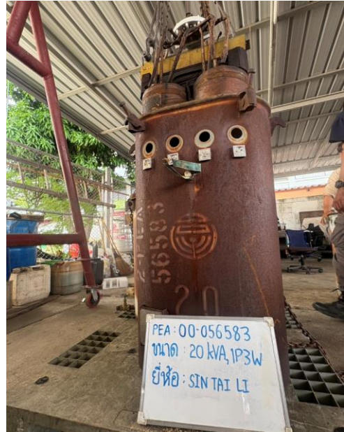
รูปถ่ายด้านหน้า : PEA TR 00-056583